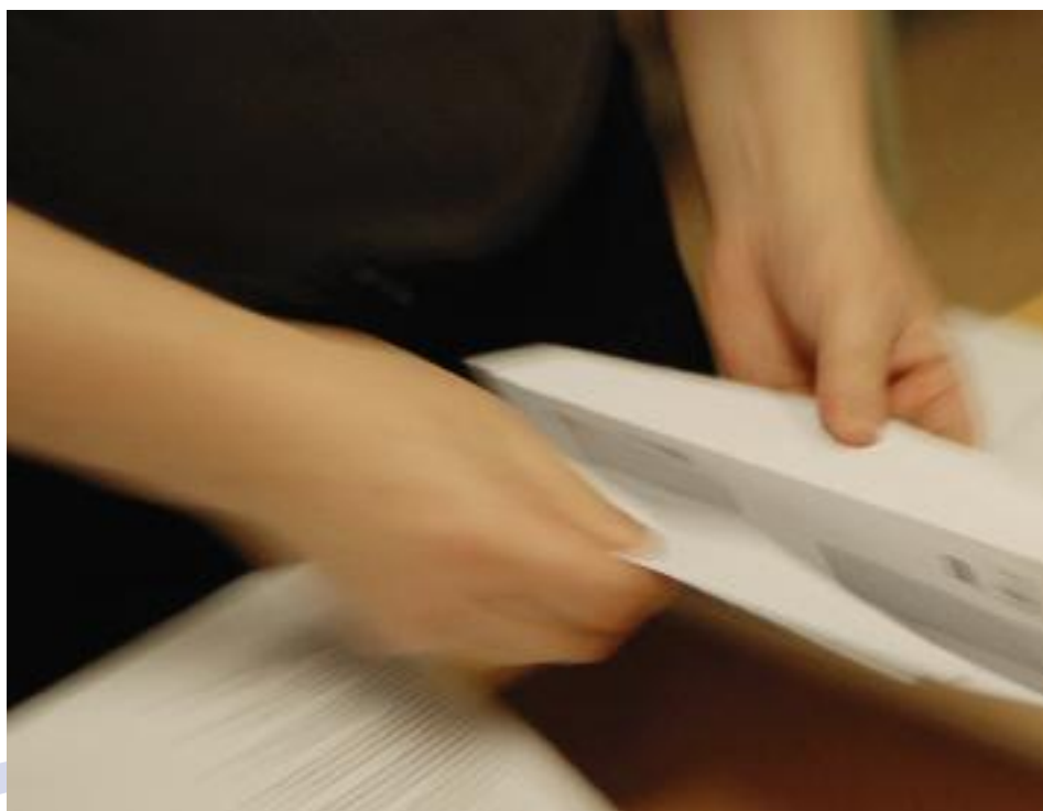
Itella hanterar hela processen från postöppning, skanning, tolkning och verifiering till arkivering.

Pappersfakturan (kredit- och vanliga fakturor) skannas tillsammans med eventuella bilagor. Vi hanterar papper i olika storlek, från post-it-lappar till A3. Det finns också möjlighet till efterskanning, dvs inskanning av deltagarlista som kopplas till en redan inskannad faktura.